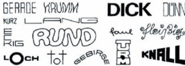
(Wagner 1982, S. 84)

Die Aussage der Dichtung wird auch dadurch vermittelt bzw. getragen, wie die Buchstaben und Worte angeordnet sind. Die klangliche und visuelle Seite von Sprache werden stark gewichtet. Die